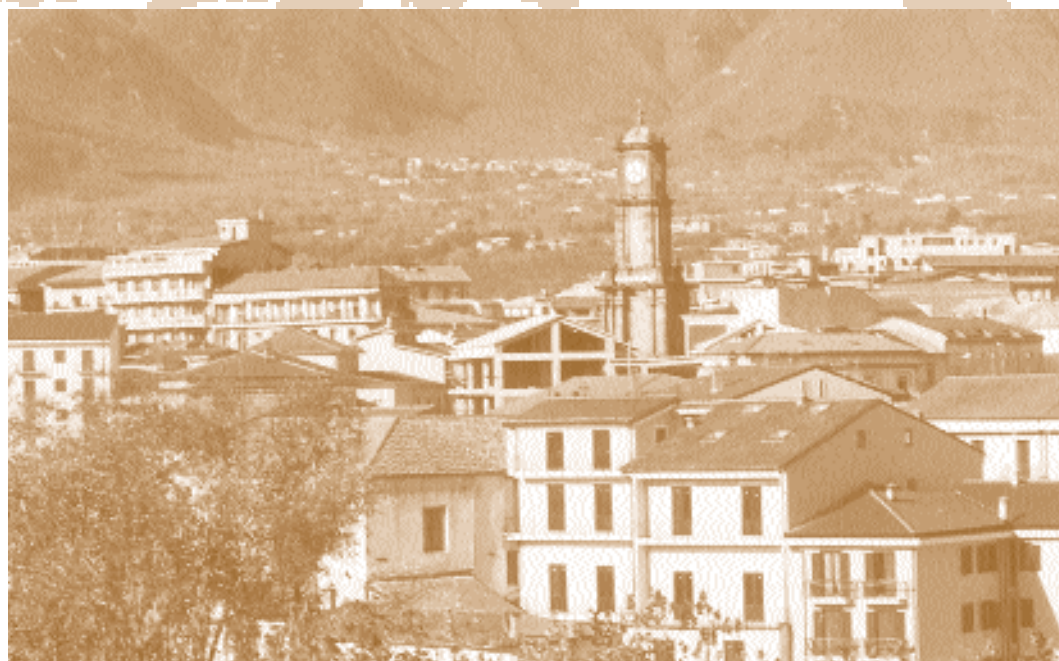
Panoramica della città che ci ha ospitato.

Ai brevi discorsi inaugurali dei presidenti Cumo, Scarascia Mugnozza, Bianco e Maccanico, mirati a dare giusto spazio e dovuto risalto alla storia della ricerca scientifica (fondamentale, finalizzata ed applicata) per lo sviluppo del Mezzogiorno d'Italia dal 1860 ad oggi, ha fatto