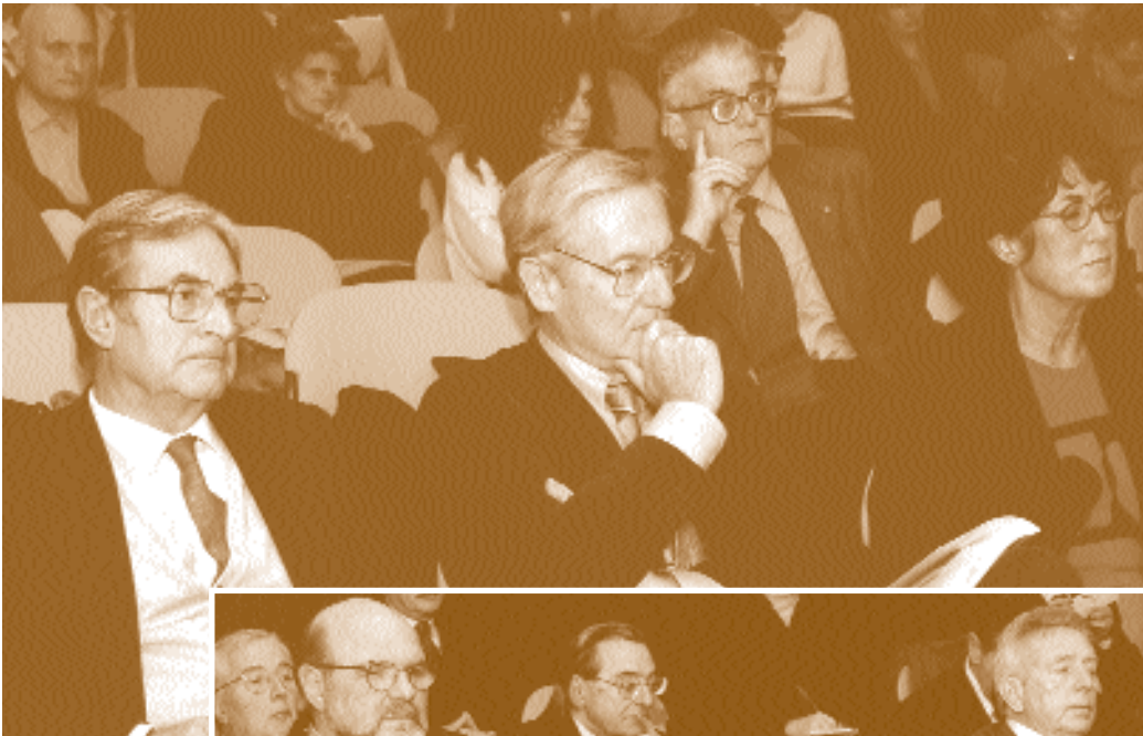
Immagini del Convegno “Personaggi e istituzioni scientifiche nel Mezzogiorno dall’Unità d’Italia ad oggi”