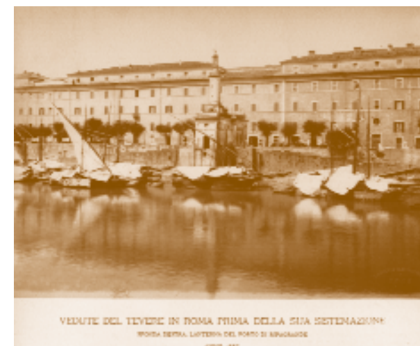
F.lli D'Alessandri (Biblioteca Vallicelliana Roma)

In questo contesto, la mostra Disegnare con