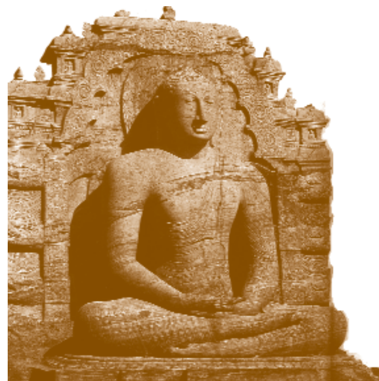
Scultura rupestre eseguita nel XII secolo a Polonnaruwa, nello Sri Lanka, raffigura il Buddha in meditazione.