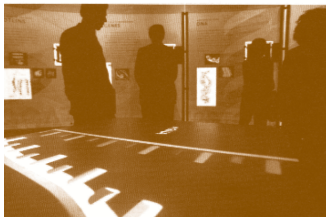
Immagine di una esposizione statunitense sulla rivoluzione genetica.

o "religiose", sembrano convergere su una valutazione materialistica di termini quasi dimenticando che alla base sia del primo che del secondo sussiste un dualismo di valutazione del valore della vita stessa.