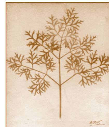
H. Fox Talbot, disegno fotografico (1839) Biblioteca Estense Modena