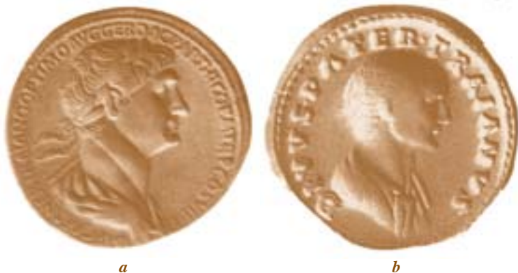
Sesterzio (dritto - a) raffigurante Traiano appellato come "optimo". Aureo (rovescio - b) raffigurante il busto del padre di Traiano che, nella leggenda, reca l'appellativo di DIVVS II2 d.C.

5. L'abitudine a vivere disciplinatamente fra persone disciplinate che trovano nell'esercito convenienza di vita e di vittoria con conseguente prestigio e sicurezza sociale, lo porterà a trovare conveniente applicare lo stesso modello di immagine, una volta diventato imperatore;