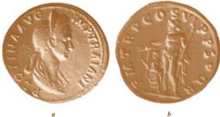
Sesterzio (dritto - a) raffigurante il busto di Plotina che, nella leggenda, ha il titolo di AUG(USTA) II2 d.C.

8. Avendo gestito eserciti in ambienti diversi, aveva estrapolato i caratteri comuni utili alla persuasione dell'opinione pubblica, trattando poi Roma o la Dacia o qualsiasi altro ambiente come era più opportuno per ottenere il tipo di successo che aveva previsto di ottenere;