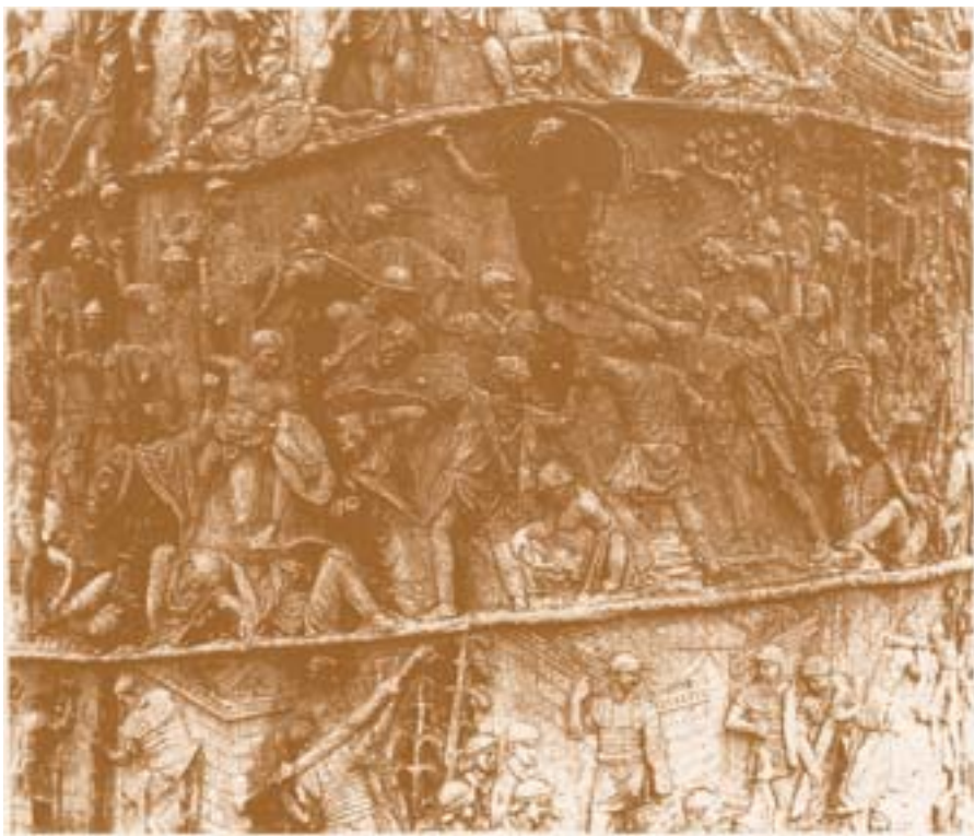
Particolare della Colonna Traiana: posture simboliche di vincitori e vinti.

• Dove arrivano i Romani, spariscono foreste e barbarie e nascono prima fortificazioni, poi città, vengono eretti ponti e luoghi sacri.